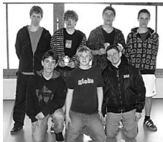
3. TV Krattigen