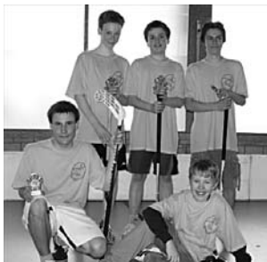
2. TV Oberhofen-Hilterfingen