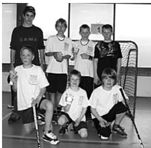
2. TV Amsoldingen