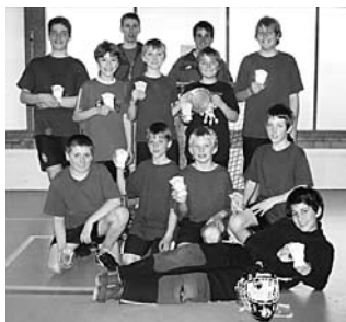
1. TV Sigriswil

Am Samstag massen sich in der Kategorie der «Jüngeren» die Jahrgänge 1995 – 97. In total 39 Gruppenspielen à je 12 Minuten wurde in 3 Gruppen um den Einzug in die Finalspiele gekämpft. So qualifizierten sich schlussendlich, nach weiteren 8 Finalrundenspielen, Sigriswil I. und Amsoldingen I. für den Final. Die Spieler aus Sigriswil liessen dabei nichts anbrennen und siegten schlussendlich verdient mit 6:3 – herzliche Gratulation.