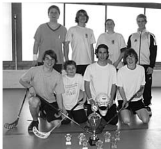
1. TV Strättligen

Nur einen Tag später, am Sonntag, massen sich in der Armeesporthalle die «Älteren» mit den Jahrgängen 1991 – 94. Am Sonntag brauchte es 36 Gruppenspiele, bevor feststand, wer sich für die Finalrunde qualifiziert hat. Nach zwei interessanten Halbfinals kam es zum Finalspiel zwischen Oberhofen-Hilterfingen und Strättligen, welches Strättligen mit 10:0 ganz klar für sich entscheiden konnte. An der Siegerehrung durften die Spieler des Teams aus Thun den neuen, von Krattigen gespendeten Wanderpokal verdientermassen in Empfang nehmen.