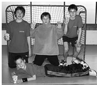
3. TV Matten

Nur einen Tag später, am Sonntag, massen sich in der Armeesporthalle die «Älteren» mit den Jahrgängen 1991 – 94. Am Sonntag brauchte es 36 Gruppenspiele, bevor feststand, wer sich für die Finalrunde qualifiziert hat. Nach zwei interessanten Halbfinals kam es zum Finalspiel zwischen Oberhofen-Hilterfingen und Strättligen, welches Strättligen mit 10:0 ganz klar für sich entscheiden konnte. An der Siegerehrung durften die Spieler des Teams aus Thun den neuen, von Krattigen gespendeten Wanderpokal verdientermassen in Empfang nehmen.